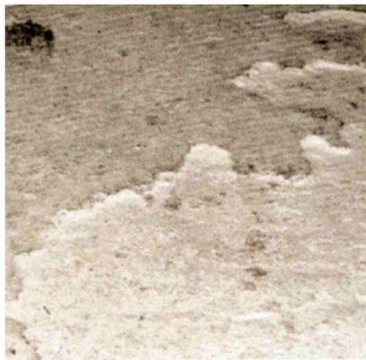
Жесткие полимерные корки, толстые и плотные

Не решает проблему очистка водой, так как растворение слишком медленное. Использование брандспойтов с большим давлением воды делает эти поверхности еще более сколькими.